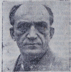
ничкото училиште во Скопје, а денес е директор на Уметничката галерија, една од најстарите ликовни установи. Добитник е на повеќе награди, како и на наградата за животно дело „11 Октомври“.