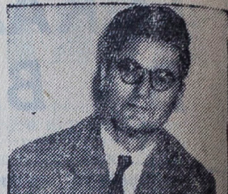
Филозофскиот факултет, потоа е шеф на катедра по Историја на книжевностите на народите на Југославија, главен уредник на Енциклопедија на Југославија за Македонија и друго.

Гимназија и Филозофски факултет завршил во Скопје уште во 1934 година, асистентски изпит и докторат подал во Загреб, 1939 година. До 1941 година е асистент на Филозофски факултет во Скопје, а од тогаш до 1946 година е асистент на Филозофски факултет во Белград. Војниот професор на Филозофскиот факултет во Скопје е од 1946, а од 1956 година е редовен професор на истиот факултет. Извесно време е продекан на