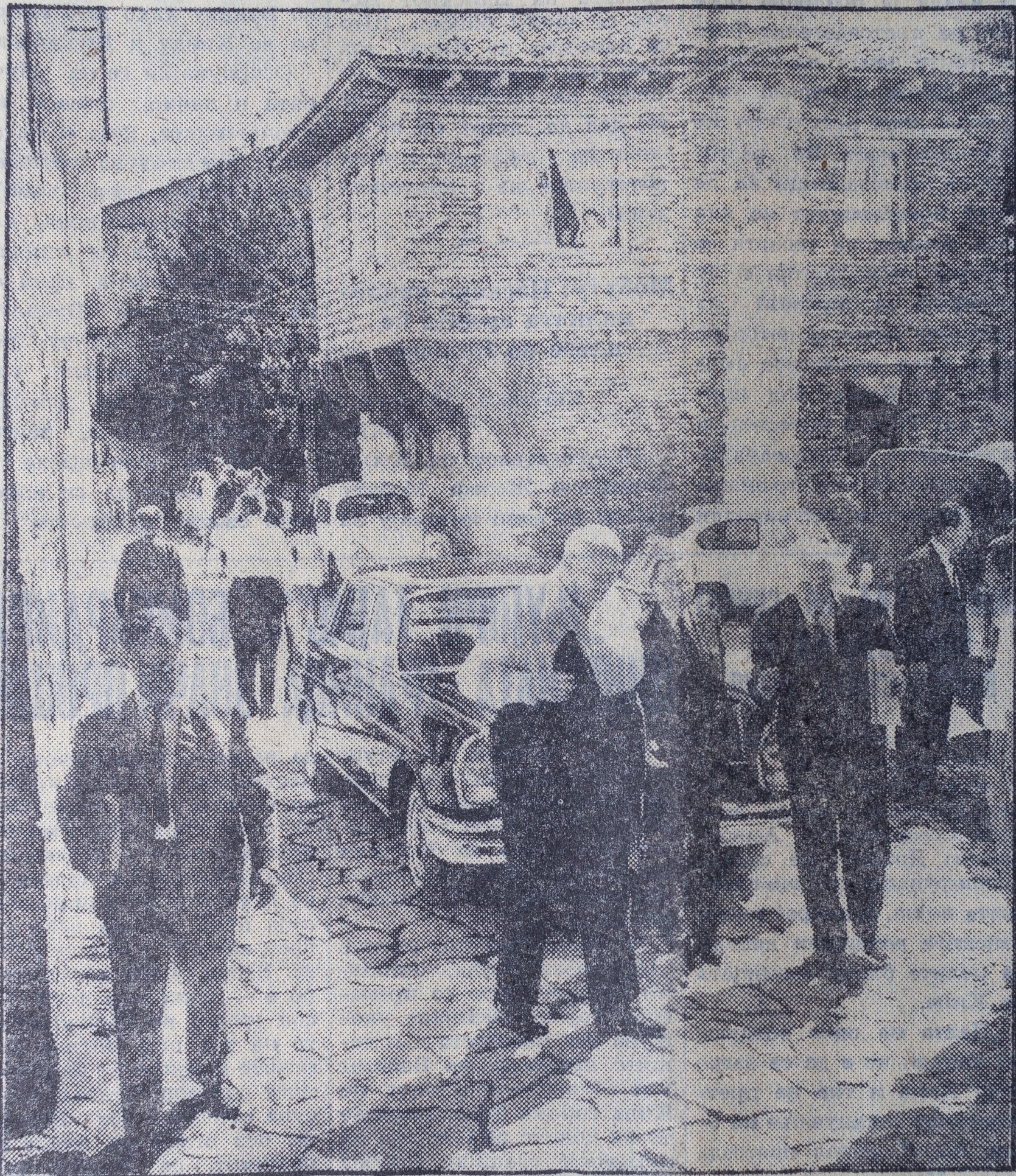
Членовите на Матичната комисија на Македонската академија на науките и уметностите пред зградата на Музејот во Охрид