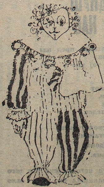
Виџетките во овој број се од Елена Дончева