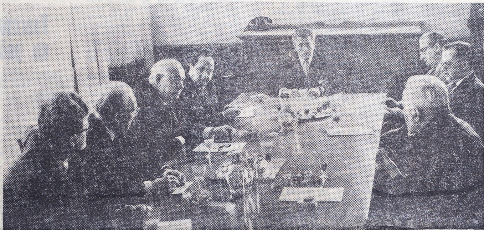
Момент од првата седница на Матичната комисија на Македонската академија на науките и уметностите