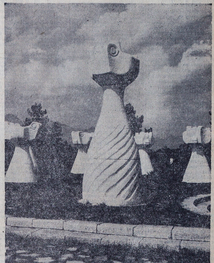
Могилата на непобедените во Прилеп

Белград, 10 октомври Претседателот на индиската влада Индра Ганди денес пристига во посета на нашата земја на покана од претседателот на Републиката Тито и претседателот на Сојузниот извршен совет Мика Шпилјак.