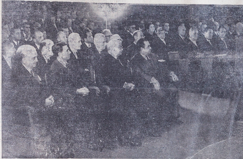
Од седницата по повод свеченото отворање на Македонската академија на науките и уметностите во Собранието на СРМ

И годинава, прославувајќи го празникот на востанието, ние ја потврдуваме длабоката свест за нашата обврска, ја потврдуваме нашата железна решеност да истраеме на патот од постојаниот развиток на Револуцијата, на новите социјалистички општествени односи, на нашата самоуправаувачка стварност, веден крпнејќи го пролабочувачки го братството и единството на нашите народи. Тоа: како наш најдрагоцен придонес за светот на правдата, хуманоста и слободата.